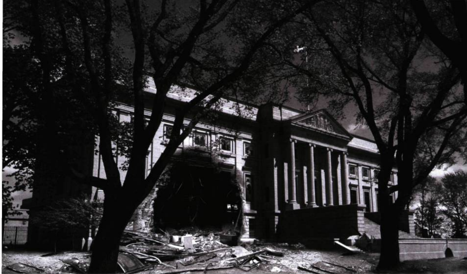
Michel de Broin, Trou , 2006. Impression au jet d'encre. Collection de l'artiste.

« Pourquoi y a-t-il quelque chose, plutôt que rien ? ». Pour cela, il faudrait réussir à ne plus rien produire du tout, ce qu'on peut bien essayer de faire, bien entendu. Michel de Broin reprend le modèle de la création, mais pour le déplacer dans ses deux pôles, l'objet créé et l'artiste créateur. Du côté de l'objet, il produit des objets ontologiquement paradoxaux. Il faut bien préciser que ces objets ne sont pas seulement équivoques dans leur sens, mais également dans leur existence. Ce sont des objets qui pourraient, ou auraient pu, ne pas exister, et même qui ne devraient pas exister du tout. Dans toutes les versions de l'attentat sur le Pentagone, que ce soit dans l'officielle ou l'alternative, aucune trace pertinente permettant d'identifier l'attaquant ne nous est donnée. L'Engin proposé par l'artiste vient à la place d'un objet définitivement manquant. Et dont l'existence concrète est incompatible avec la vérité, quelle qu'elle soit. C'est un objet qui ne peut pas être. Mais c'est justement pour cela qu'il s'agit d'un objet d'art. Car seul, l'objet d'art peut exister comme paradoxe, se maintenir, circuler, voire rejoindre un public tout en conservant son statut entre le vrai et le faux, entre l'être et non-être.